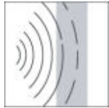
enddröhnen + dämpfen

Sie können aus einer Vielzahl von Konfektionierungs- und Ausrüstungsmöglichkeiten wählen.